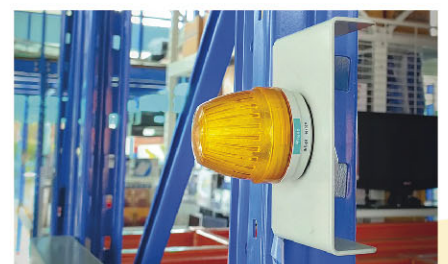
Running indicator with buzzer