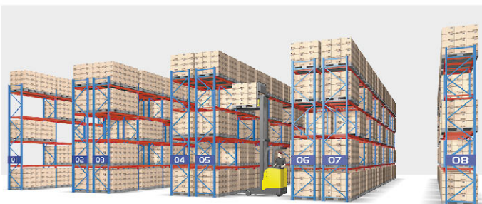
Selective Rack in conventional arrangement

Total storage area = 550 m 2 Pallet locations = 800 Pallets