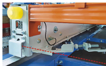
Obstacle detector checks floor