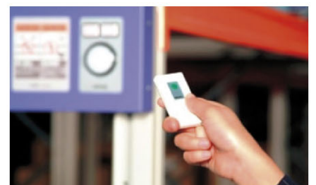
Quick operation from forklift using remote controller