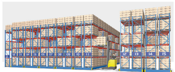
Mobile Rack for the requirement of higher storage capacity

Total storage area = 550 m 2 Pallet locations = 800 Pallets