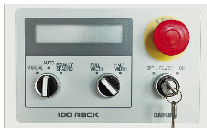
Simple operation panel with mode display