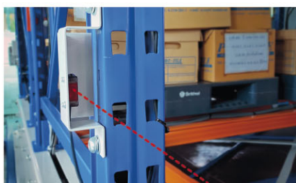
Trespass sensors check for forklifts and operators