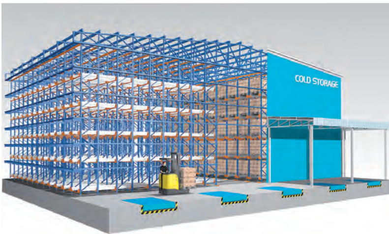
Shuttle Rack Supported Building for Cold Storage